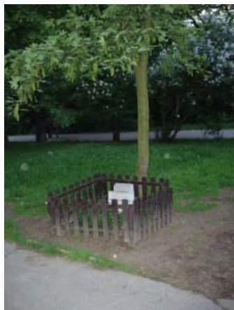
stav 15. 5. 2006